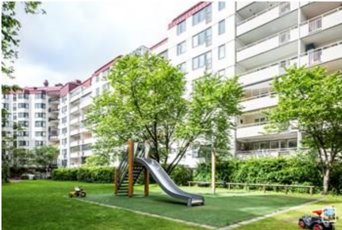
Lekplats på öppen – avgränsad gård