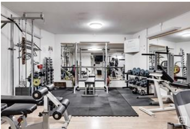
Motionsrum på Linnégatan 70