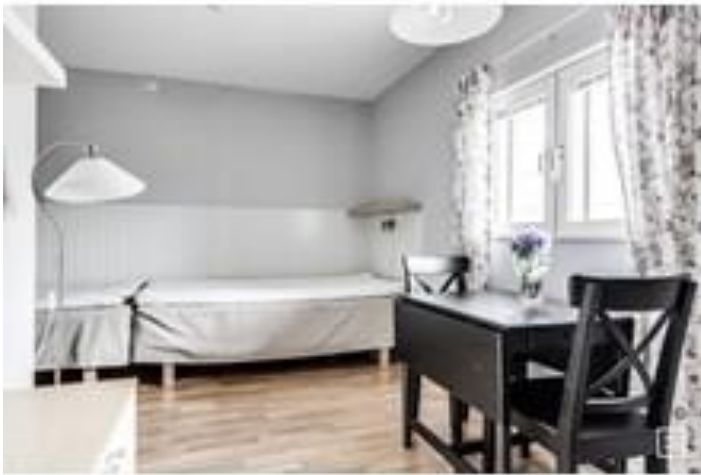
Övernattningsrummen med egen toa/dusch/WC