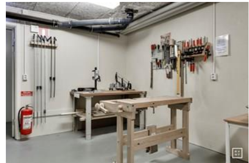
Hobbyrum på Linnéplatsen 5-6