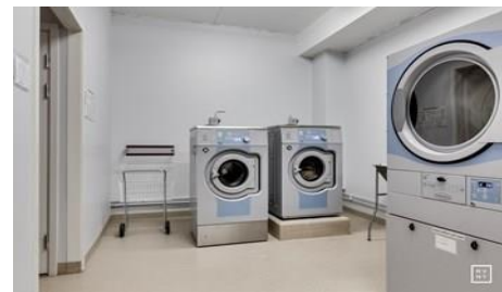
Fyra tvättstugor med två maskiner i varje, separat tumlare och torkrum/skåp